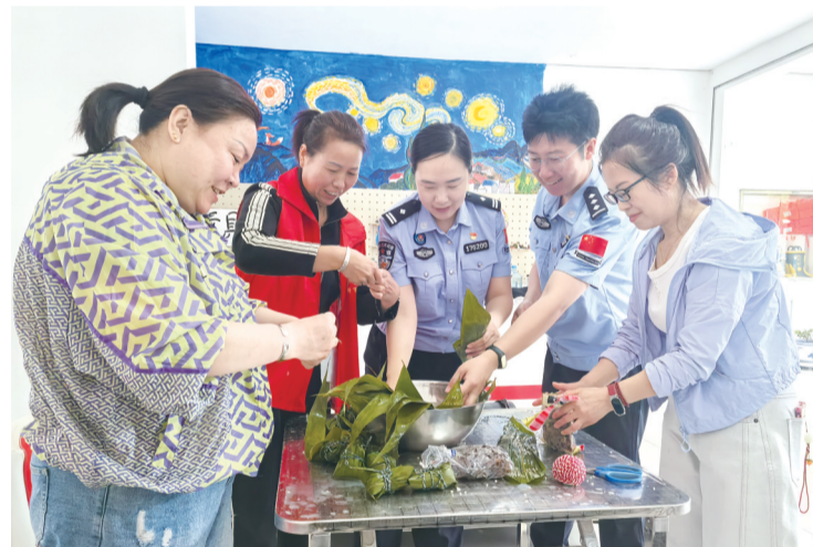
齐聚一堂包粽子

粽子包好后,民警和社区志愿者上门走访派送粽子。大家优先走进辖区独居老人、高龄老人、困难家庭中,将粽子送到大家手上。每到一户,工作人员都与居民亲切交谈,细致询问大家的生活近况、身体状况,耐心倾听居民的需