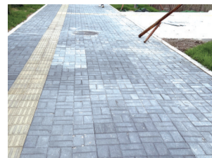
报道后:路面修复平整

6月10日,《城市晚报》A5版以《长春市民反映:一处人行步道地砖塌陷亟待修复》为题,关注报道了长春市南湖新村中胡同与南湖大路交汇处,人行道地砖出现塌陷,部分路面地砖翘起的问题,地砖塌陷给行人通行带来安全隐患。报道见报后,相关部门迅速行动,目前塌陷处已修复平整。