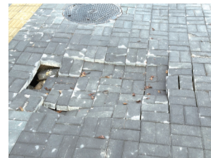
报道前:人行步道地砖塌陷鼓起