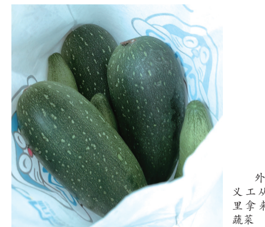
外地义工从家带来的蔬菜

策划:史慧玉 孙振余 王首道 文字:城市晚报全媒体记者 毕继红