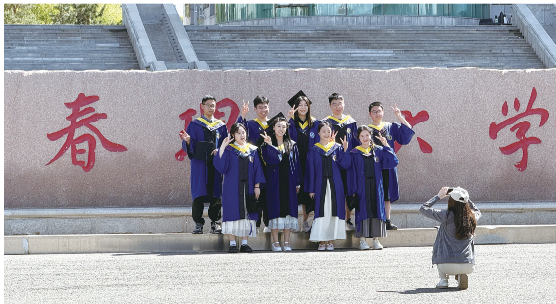
高校的毕业生们拍照留念

进入6月,又一年毕业季如约而至,难分难舍在校园!连日来,长春各大高校的毕业生们,在完成各项功课和学业收尾之际,以独特创意“致青春”,用镜头留住最美年华。