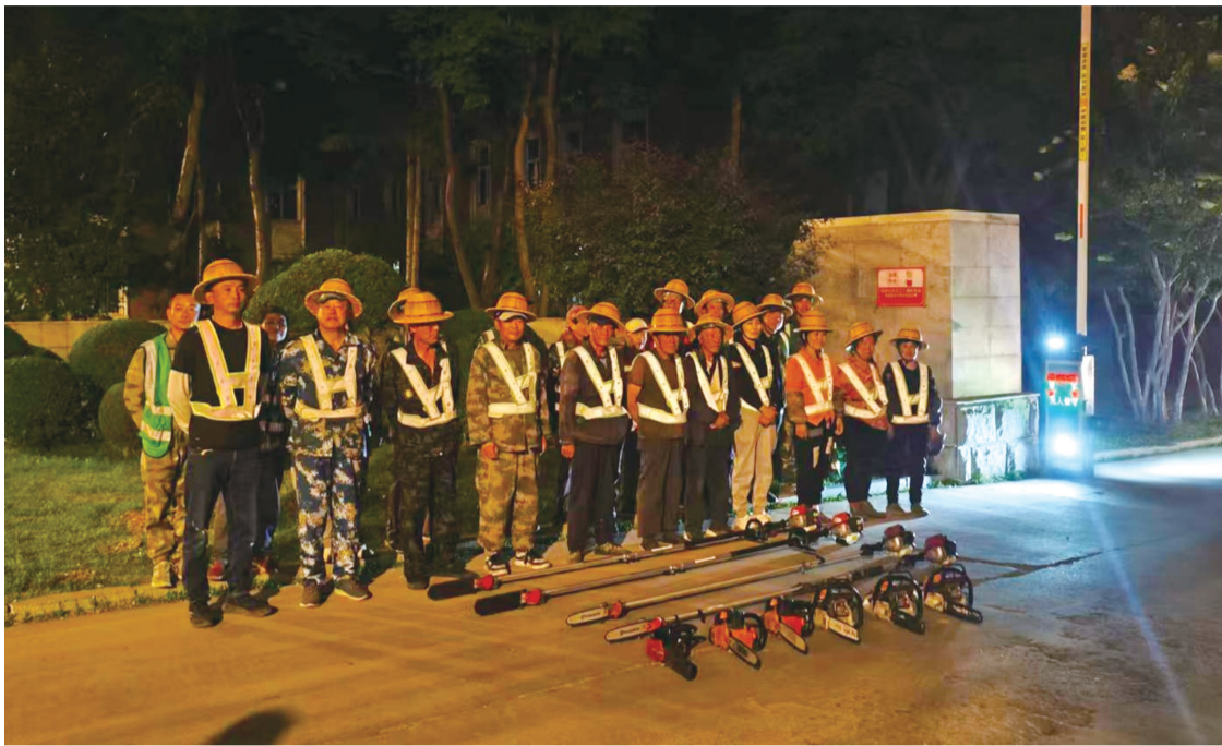
连夜出动应急巡视人员

抓共管的工作格局。作为市级街路主力军,长春市绿管中心连夜出动应急巡视人员63人,调度高空作业车、吊车、枝丫粉碎车、载重汽车等各类专业作业车辆19台,聚焦所辖26条主要街路,重点排查行道树、绿化带及周边设施,及时修剪枯枝断枝、清理倒伏树木、处置松动设施,严防次生灾害发生。