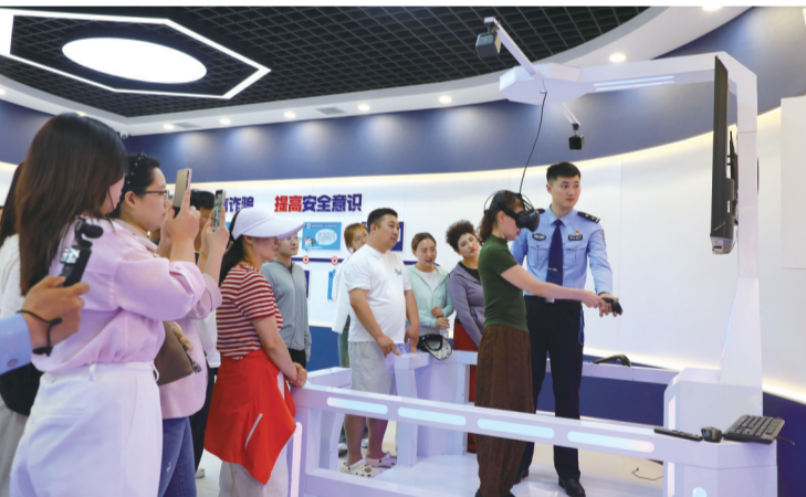
反诈VR安全体验

走进反诈VR安全体验馆,告别枯燥说教与传统横幅展板,一套高度沉浸的VR体验系统成为最大亮点。体验者佩戴VR头显后,即刻置身360°全维度虚拟场景,真实复刻刷单返利、冒充客服、虚假贷款、“杀猪盘”等高发诈骗类型。从骗子诱