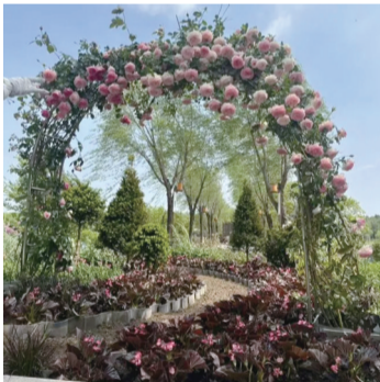
翻新后的拱门

为深入贯彻落实“过紧日子”工作要求,始终坚守节约高效、提质增效、绿色低碳的园林绿化工作准则,近期,长春市南湖公园创新优化园区彩化布置方案,以优选长效绿植品种、盘活存量老旧设施、严控造景养护成本为抓手,在全面提升园区景观品质、美化游园环境的同时,切实压降绿化开支,实现生态景观提质与经