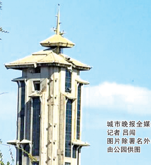
城市晚报全媒体记者 吕闯 图片除署名外均由公园供图

被誉为净月潭里“小江南”“白洋淀”的拾玖岛湿地竹筏游览区,“五一”期间也焕新开业,以全新姿态解锁长春人休闲度假新选择。作为长春独有的原生态湿地竹筏游览地,景区在坚守自然本底的同时,新增自驾乌篷船、升级服务配套,让每一位游客都能沉浸式感受湿地之美,在喧嚣都市旁,寻得一份独属于长春的松弛与惬意。不用奔赴江南,在长春就能邂逅“水上江南”的诗意与浪漫!