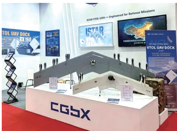
长春新区无人机有限公司在展会上展示产品

近日，长春新区企业无人机有限公司亮相亚洲最大、最具影响力的防务与国土安全展之一——2026马来西亚吉隆坡国际防务展(DSA 2026)，硬核产品斩获全球专业认可，迎来全球多国政府、军方代表团及行业专业观众参观交流，充分展现长光博翔在工业及军用无人机领域的技术实力与产品竞争力。