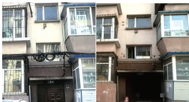
整治前线网杂乱(左),整治后整洁有序

为推进城市精细化管理、做好大冬会保障工作，切实解决老旧小区线缆杂乱问题，在长春市城市管理局统筹指导下，由通信企业负责实施的南关区体院小区及周边架空线整治工程顺利竣工。