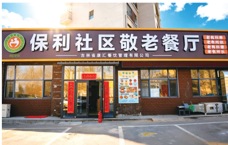
敬老餐厅

“年纪大了自己做饭不方便,孩子们在外出工作也总放心不下,现在下楼就能吃到热乎乎可口的饭菜,味