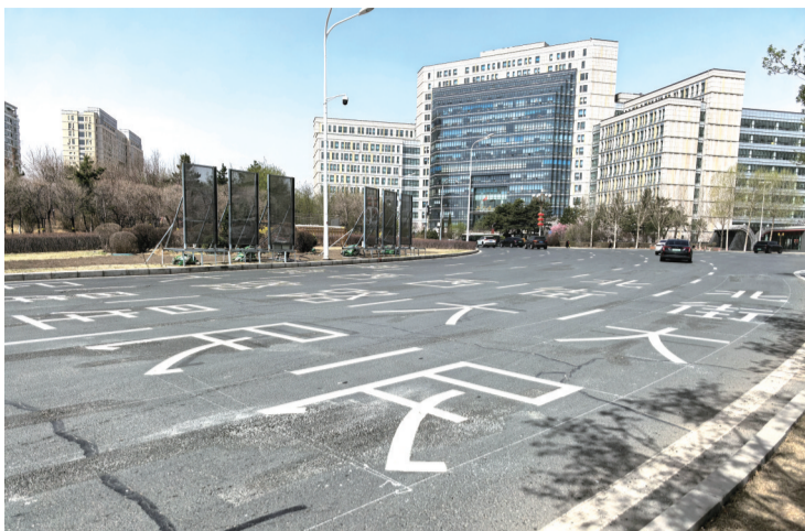
卫星路东口北侧车道,沿着标线行驶便可驶离