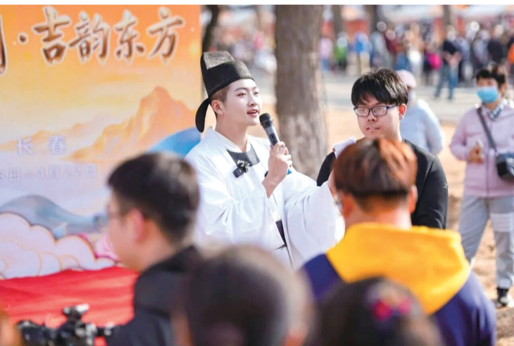
新民大街上的“李白”

脱下华服,他是驻守在吉林边境线上的藏蓝卫士,顶风冒雪、坚守岗位,用忠诚守护家国安宁;穿上华服,他是传播中华文脉的使者,吟诗作对、传递雅韵,用热爱点燃传统文化的星火。这份看似“反差”的身份,背后是一份跨越岁月的执着与