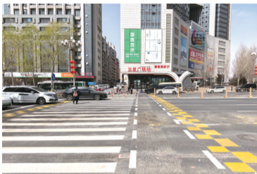
拉链式黄色块提示线