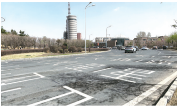
人民大街南口东侧车道