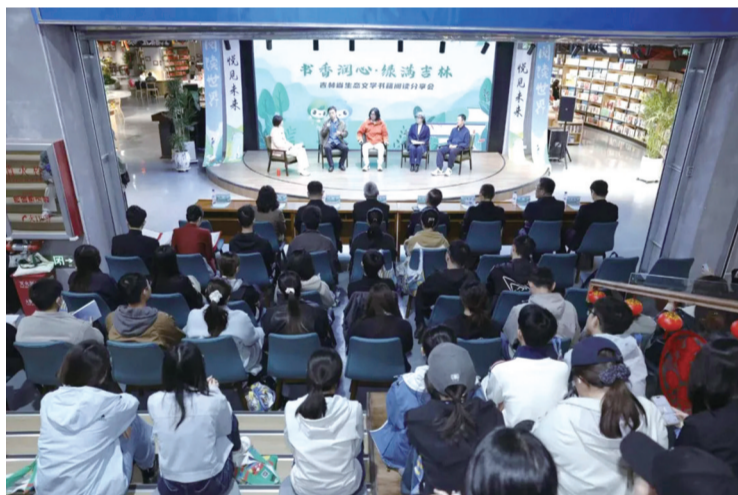
生态文学书籍阅读分享会现场

一张印着吉林地图的展板,树叶、花瓣形状的便利贴,来宾们书写生态寄语,领取“种子书签”,在书香与绿意中开启分享之旅。随后的读书分享会上,主持人与作者代表围绕“文学中的吉林生态”展开对话,分享了吉林省草木生长环境、莫莫格湿地鹤影等采风创作背后的故事,探讨了新时代生态文学如何架起公众与自然之间的桥梁。特约嘉