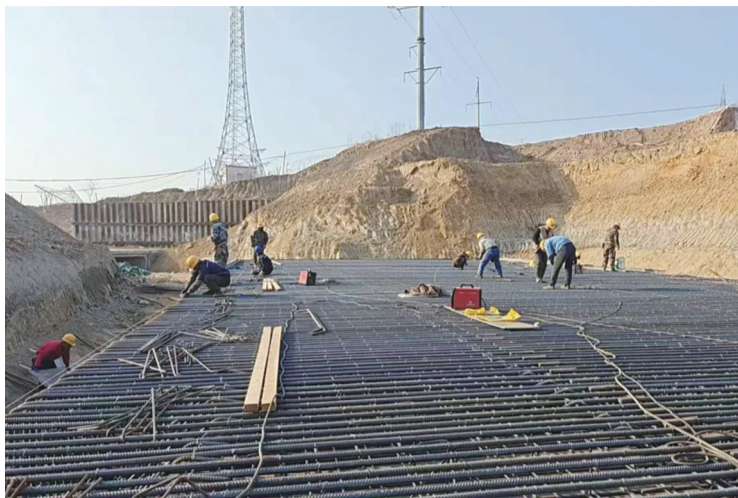
建设工程全面复工

在白城地区,省道安通线、扎突线项目于3月末全面复工复产。去年以来,安通线完成29.7公里路基土方及涵洞工程,扎突线完成8.4公里主线及新开河中桥主体工程,为完成年度建设任务奠定坚实基础。复工前夕,白城市交通运输局牵头统筹,勘察测绘、设备检修、安全培训同步推进,以高标准筑牢安全与质量防线;复工后,项目团队紧盯节点,在严守安全质量底线前提下全速推进,线路建成后,将完善区域路