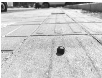
金桔路盲道上也有螺丝凸起

近日,有市民反映长春净月高新区多个路段人行步道有螺丝(地钉)凸起,行人稍有不慎可能会存在被磕绊的风险,对此,希望有关单位能及时清理这些“绊脚石”。