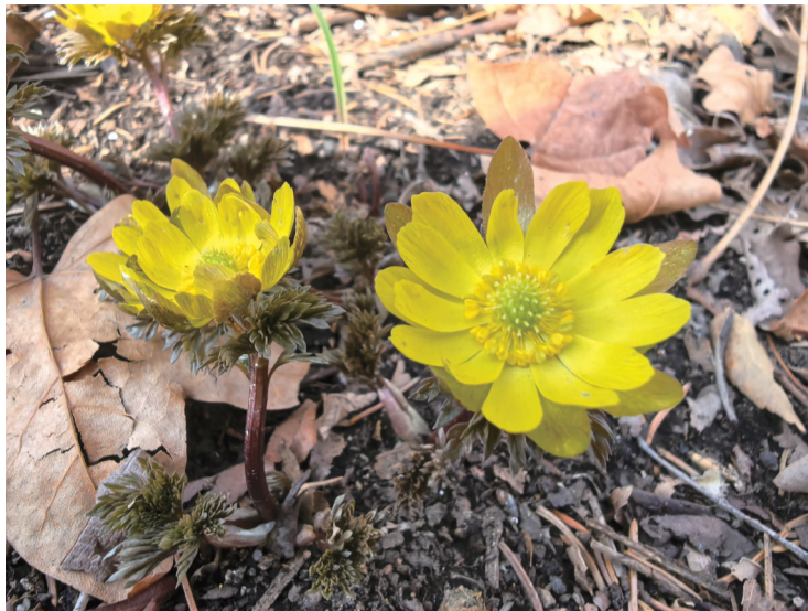
北湖公园的冰凌花耀眼夺目

目前,长春已经有7个公园可赏冰凌花,分别是长春净月潭景区、长春百花园、长春友谊公园、长春公园、长春南湖公园、长春百木园、长春北湖公园。冰凌花花期多集中在