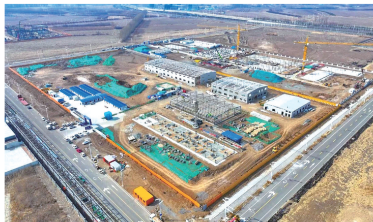
永固电子级胶粘剂生产项目现场

“项目于去年8月中旬进场施工,已完成部分车间、库房的钢架施工,公辅车间、综合楼的基础施工和其它附属工程施工。”永固电子级胶粘剂生产项目建设相关负责人说,目前,永固电子级胶粘剂生产项目已经全面复工,计划今年10月份建设完成一车间、甲类库房、公辅车间、综合楼等7个单体,争取早日投入生产,项目建成后预计实现年产值1.5亿元。