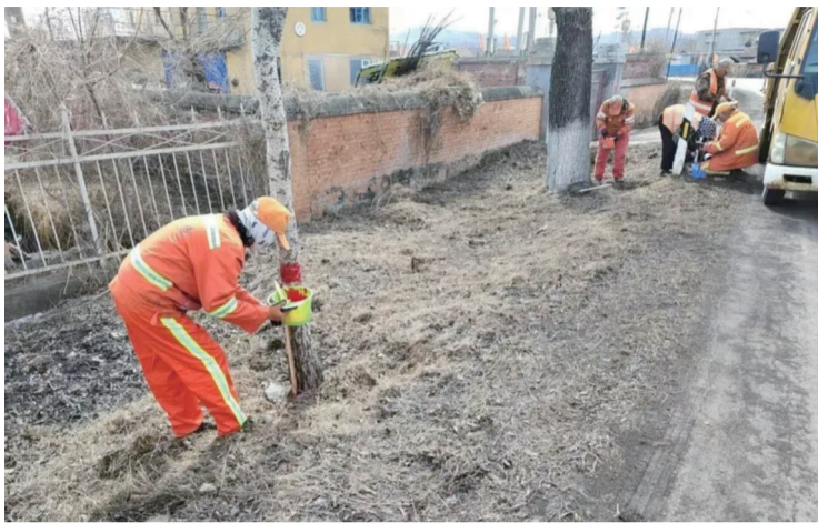
养护人员作业中

调,要持续强化我省普通干线公路养护管理系统的应用,各地通过数字化、实时化手段,实现路况信息及掌握、养护任务迅速响应。同时,将安全生产贯穿工作全过程,严格按照规范布设作业区,并重点对急弯陡坡、临水临崖、平交道口等路段的安全设施进行全面排查,及时消除