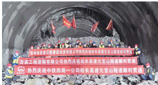
元宝山隧道右线顺利贯通

近日,随着一阵爆破轰鸣,松长高速元宝山隧道右线顺利贯通。元宝山隧道地质条件复杂,同时也是全线最长的隧道。此次贯通,不仅彰显了施工团队精湛的技艺,也标志着松长高速这一复杂工程取得关键进展,为全线按期通车奠定了坚实基础。