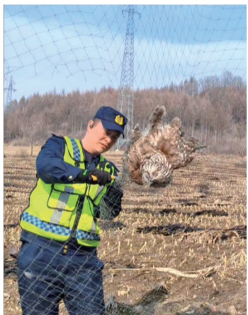
巡查发现长尾林鸮

春归旷野,和风淡荡,为保护环境和野生动物,保障道路通行安全,有效防范野生动物上路引发交通安全隐患,近期,吉高集团通化分公司各养护工区利用无人机对属段易发生野生动物上道的路段开展重点巡查。