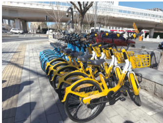
4月1日正式投放运营