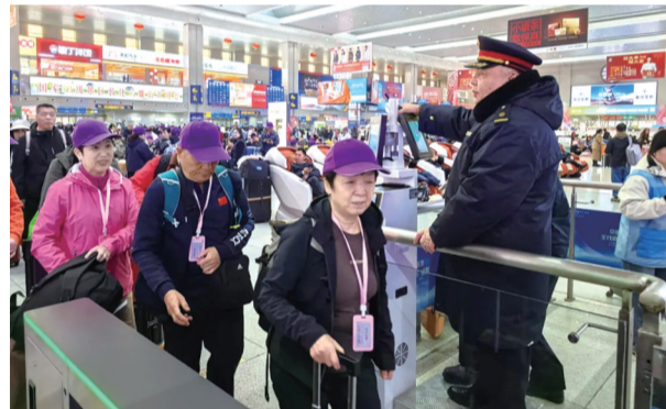
开辟绿色通道

3月28日、29日18时11分,伴着清脆的鸣笛声,Y444次长春至贵阳、Y454次长春至广州白云旅游专列相继驶离站台。近1500名旅客怀揣着对远方的向往,从长春站踏上温馨旅途。长春站以周密的部署、高效的联动,圆满完成这两趟旅游专列的运输保障任务。