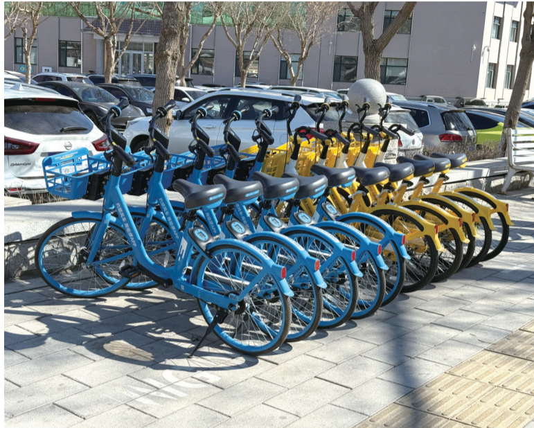
共享单车为绿色出行提供便利

“为做好今年共享单车运营管理工作,长春市城市管理局提前谋划,2月底即组织共享单车企业开展运营前准备工作。”长春市城市管理局市容管理处二级调研员王真亮介绍说,一是重新采集优化投放共享单车点位6000余处,目前全市单车点位共计1.3万余处;二是督促单车企业对投放的5.7万辆单车进行全面清洗、检查、维修,确保所有车辆处于最佳