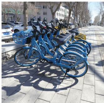
城市管理局将加强运营秩序监管

天气转暖,春意盎然,共享单车再上岗!城市晚报全媒体记者从长春市城市管理局获悉,长春市共享单车将于4月1日正式投放运营,全市计划投放单车5.7万余辆,为市民绿色出行提供便利。