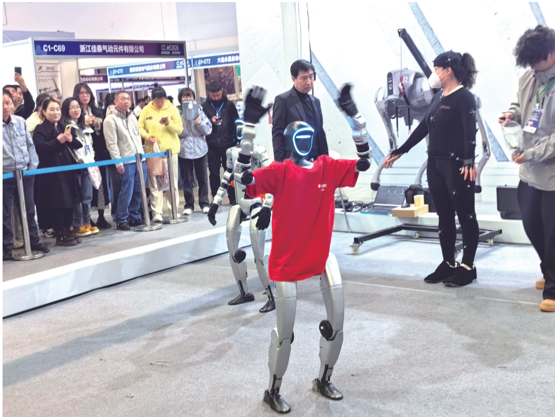
宇树科技的机器人在表演

尤为引人注目的是,宇树科技此次展出了2026年马年春晚同款人形机器人,让现场观众近距离感受“春晚黑科技”的魅力。这些机器人动作轻盈迅捷,堪比少年侠客,现场演示的武术招式行云流水,翻转、踢腿、挥拳等连招一气呵成,完美复刻春晚舞台上的精彩表现。展区负责人介绍,春晚同款机器人搭载了全自主集群控制技术,