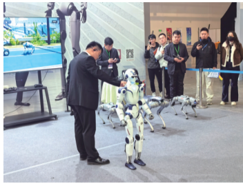
机器人动作轻盈迅捷

3月26日,为期三天的2026第18届长春先进装备制造业博览会(以下简称“长春制博会”)在长春东北亚国际博览中心正式拉开帷幕。本届展会以“智汇春城,链动未来”为主题,汇聚国内外500余家顶尖制造企业,集中展示装备制造领域前沿技术与成果,紧扣东北老工业基地全面振兴战略,依托长春汽车及零部件、人工智能等产业优势,搭建起“中国制造”与全球“工业4.0”深度融合的交流合作平台,为东北制造业高质量发展注入新活力。