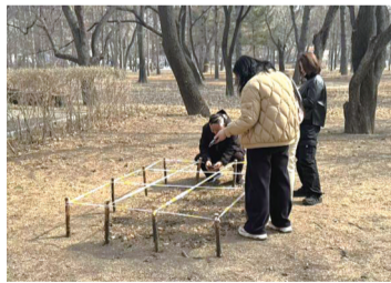
市民在南湖公园赏花