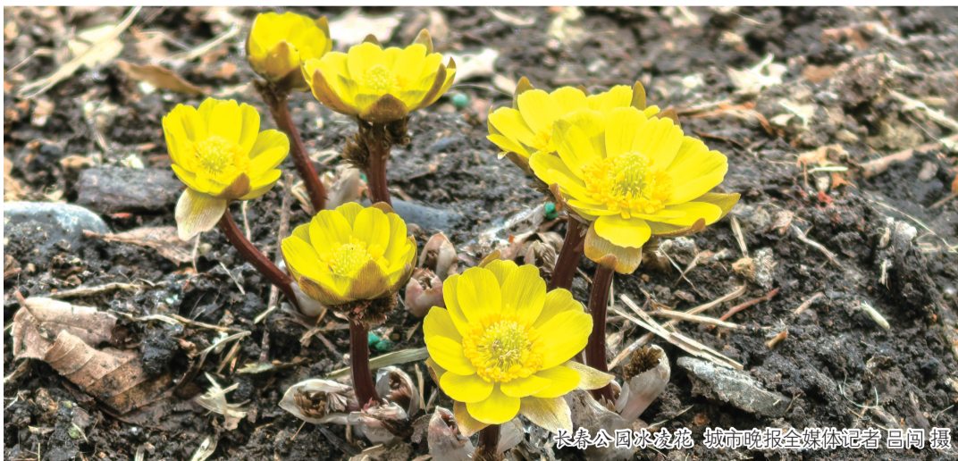
长春公园冰凌花