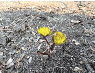
南湖公园冰凌花

继长春净月潭景区、长春百花园、长春友谊公园冰凌花相继开放后,昨日,又传出好消息,长春南湖公园、长春公园的冰凌花也开了。美丽的冰凌花成为城市一道别致的早春风景,也为市民早春赏景又增添新去处。