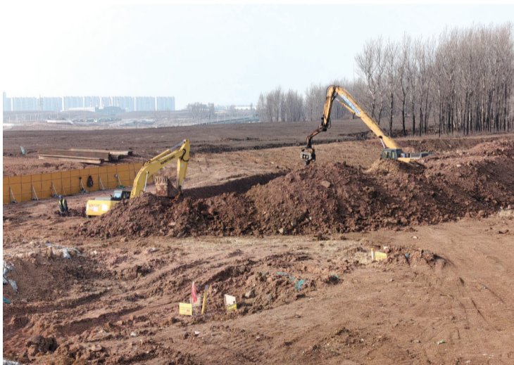
钩机正在紧锣密鼓地施工中

上午9时许,城市晚报全媒体记者来到人民大街南延工程(二标段)核心施工区域,这里北起绕城高速,南至永春快速路,是此次南延工程的关键路段。记者注意到,靠近绕城高速的道路已部分完成沥青铺设,平整的路面向南延伸,道路两侧的路灯基座已安装完毕,部分路段已完成路灯安装和树木种植,新栽的苗木整齐排列,为这条未来的城