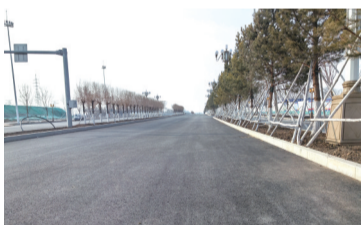
部分路段路面已经铺好,绿化成型