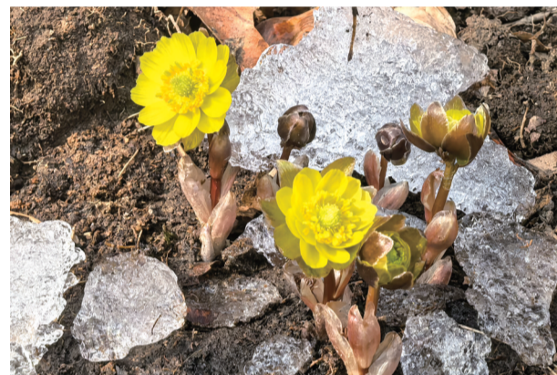
小小冰凌花淡雅迷人