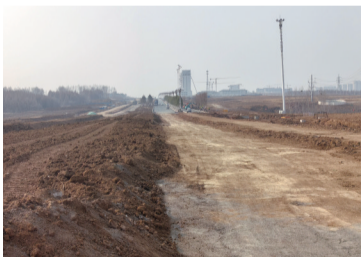
南延线向南延伸正在施工中

25日,城市晚报全媒体记者在深入长春人民大街南延工程施工现场踏查了解到,作为长春市重点城建项目,该工程正按计划稳步推进,现场机械轰鸣、施工人员各司其职,一派繁忙有序的建设景象。目前,工程部分路段已实现通车,剩余路段基础施工、配套设施建设也在同步发力。