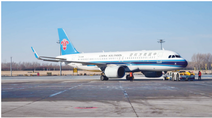
夏秋航季航班计划敲定

其中,长春至上海浦东航线加密至每日6班,打造高频次空中快线,无缝衔接长三角国际航空枢纽;