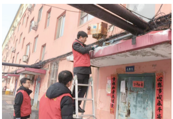
社区工作人员维修雨搭

近日,临江市兴隆街道民主社区在入户排查走访中,发现辖区多个单元雨搭因年久失修,存在锈