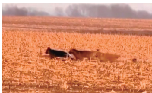
网友拍摄它们穿越农田

这段仅有11秒的视频里,众狗狗把德牧围在中间,德牧偶尔停下舔舐尾部。深夜、快速路、七只狗狗抱团一样前行,触动了众多爱狗人士的心,话题迅速发酵。次日又有人拍到七只狗狗在农田里组团前行,一群排队穿行在农田中的狗狗,加上网友配的史诗般壮烈的背景音乐,网友们特别心疼:“这一定是穿越艰难险阻也要回家!”