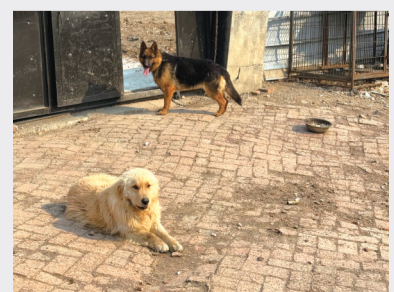
德牧“四宝”和金毛“长毛”