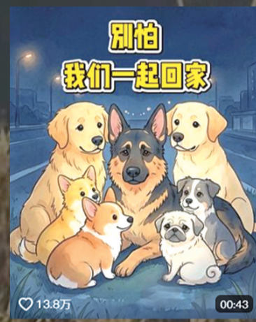
网友做的视频封面