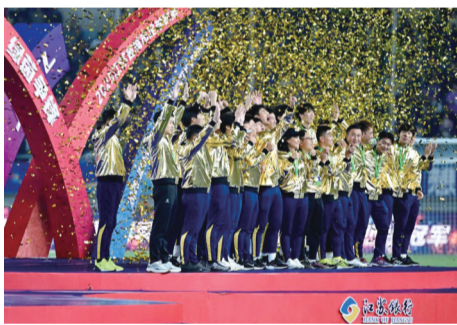
2025年11月1日,“苏超”冠军泰州队在颁奖仪式上庆祝。