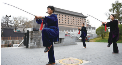
3月19日,市民在西安城墙环城公园安定门外练习太极剑。

新华社福州3月20日电(记者刘旻 吴俊宽)2026年全国群众体育工作会议20日在福建南平召开,会议期间发布了健身设施、赛事活动、健身指导等方面的一系列数据,描绘出2025年我国全民健身事业在惠民利民中高质量发展的图景。