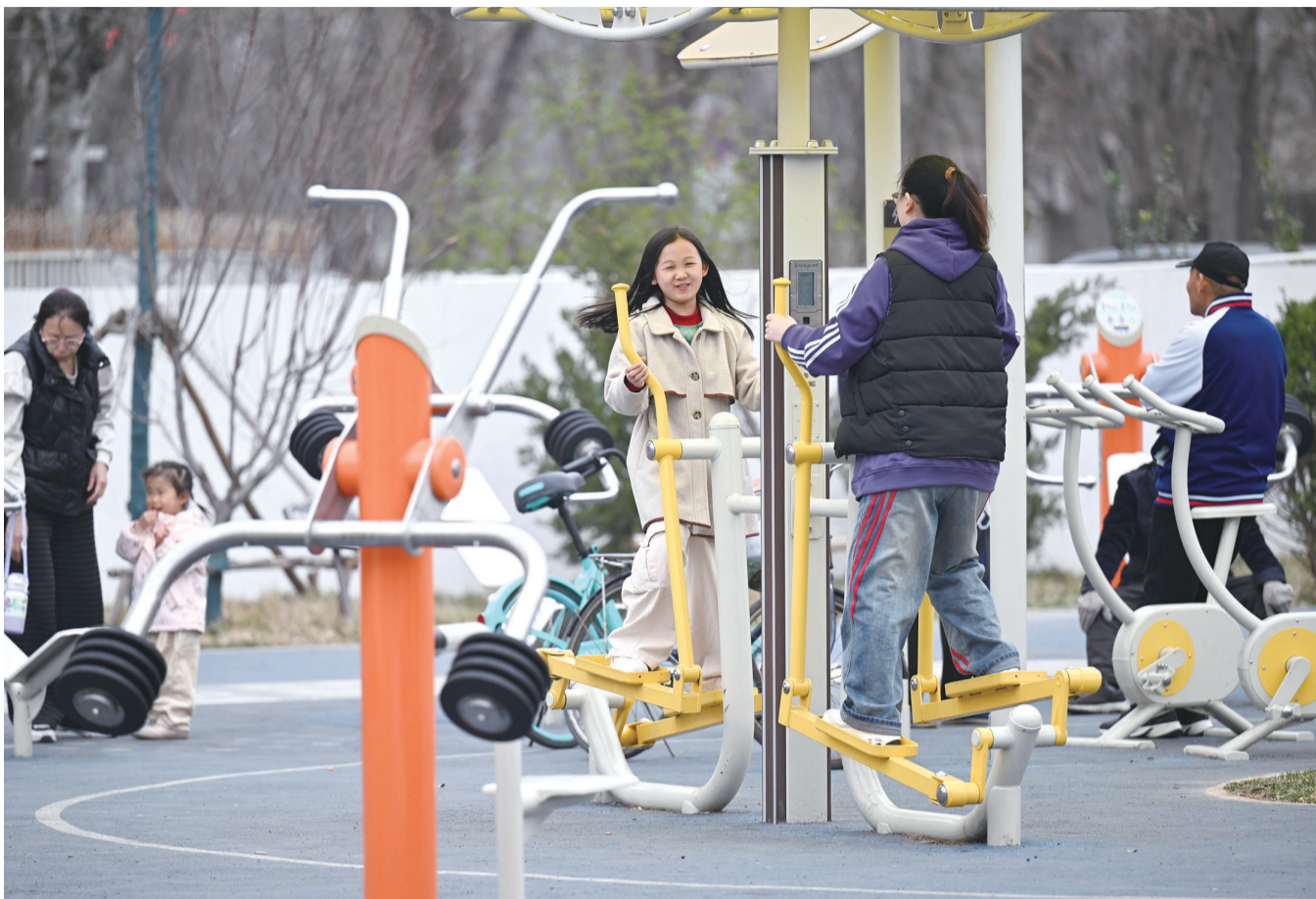
居民在天津市红桥区罗浮路口蒙公园内锻炼(3月21日摄)。