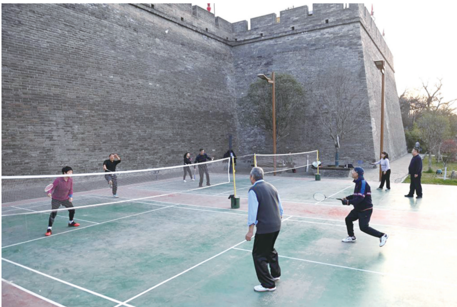
3月20日,市民在西安城墙环城公园文昌门至和平门段打羽毛球。

国家体育总局群众体育司司长陈杏年说:“一张张球台、一片片场地嵌入老旧小区、街头绿地,让‘小球’转动‘大民生’。调研时,有社区群众说:‘现在下楼就能挥两拍,日子美得很。’”