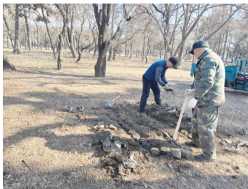
南湖公园今年又补植冰凌花