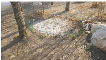
友谊公园冰凌花区域

三月,冰雪渐消融的北国春城,正积蓄着无限的生机。而每到此时,被誉为“报春第一花”“林海雪莲”的冰凌花总会在春风中率先牵动着人们的思绪,拨动着人们的心弦。目前,长春净月潭景区的冰凌花已经破冰而出,含苞待放,除此之外,长春市内一些公园的冰凌花也正在积蓄力量,市民游客们寻花、赏花莫心急,静待花开报春来!