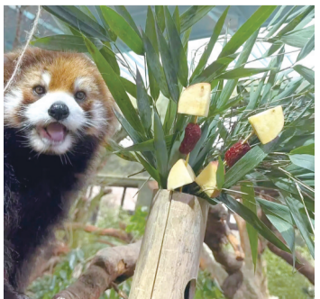
游客可更直观看到小熊猫进食

熟悉的美味依旧,小熊猫的“餐桌”却焕然一新。近期,长春市动植物公园为了让游客更直观、无遮挡地观赏小熊猫进食的可爱日常,专门打造了全新取食景观,进一步优化动物生活环境与观赏体验。