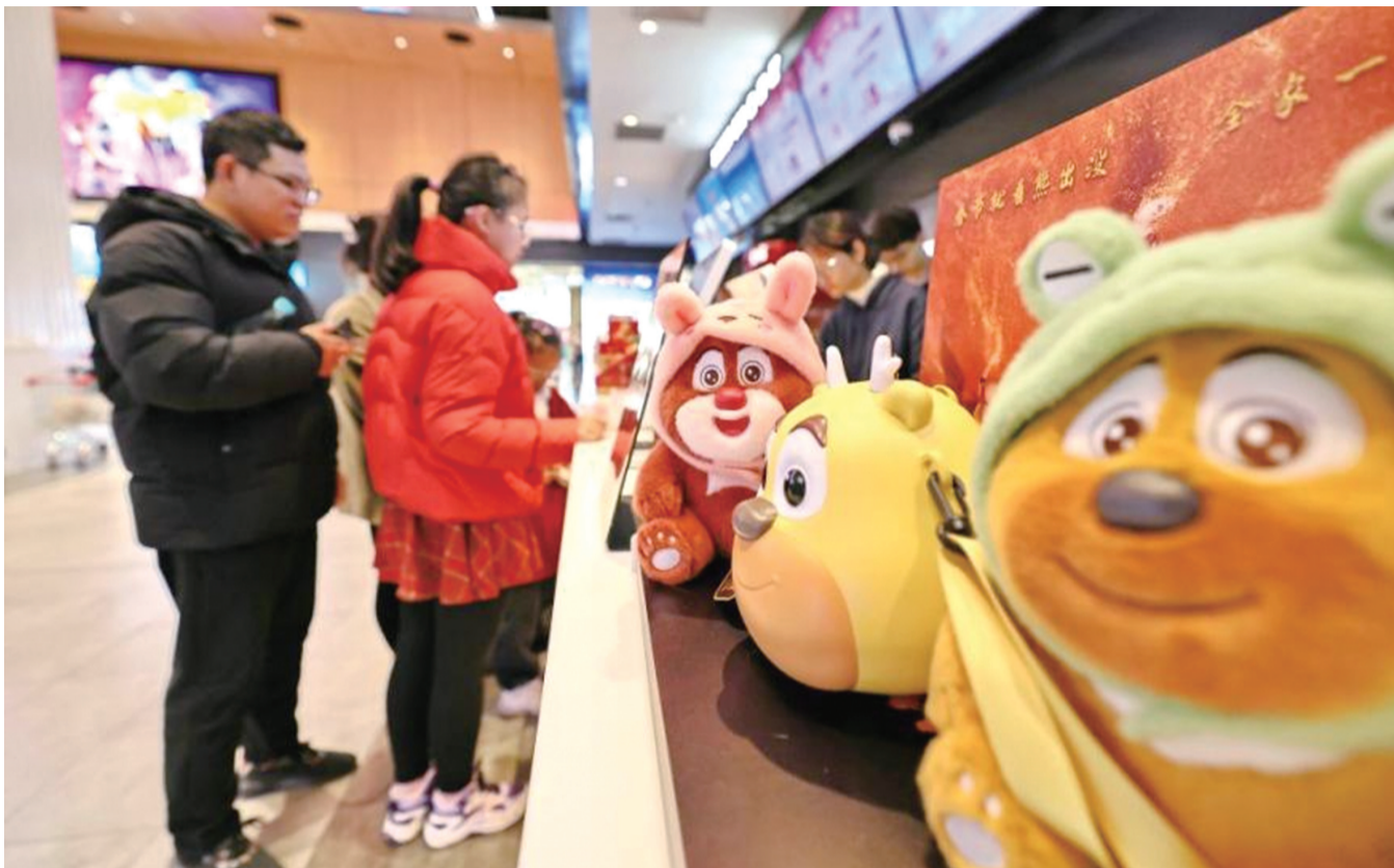
2月20日,在浙江嘉兴南湖嘉影银河影城,观众购票准备观影。新华社发 金鹏 摄

值得注意的是,部分创新题材影片市场表现不及预期。有观点指出,观众在春节档对熟悉IP和类型有天然亲近感,创新作品需要更高的市场沟通成本。这也提示行业,春节档的高票房具有特殊性,日常市场的培育同样关键,需要更多元的影片供给来支撑全年市场。