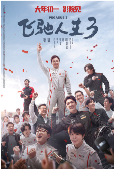
电影《飞驰人生3》海报

如何将节庆的集中释放转化为日常的细水长流,如何让光影的魅力更深入地融入文旅消费与城市生活,正成为行业共同探索的方向。在经历高位运行后的市场回调期,行业更需关注内容创新与日常观影习惯的培育,推动中国电影在内容为王、生态多元的轨道上,实现从节庆驱动向日常活力的持续转化。