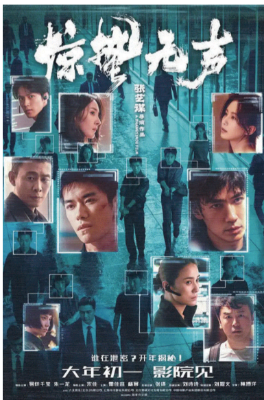
电影《惊蛰无声》海报