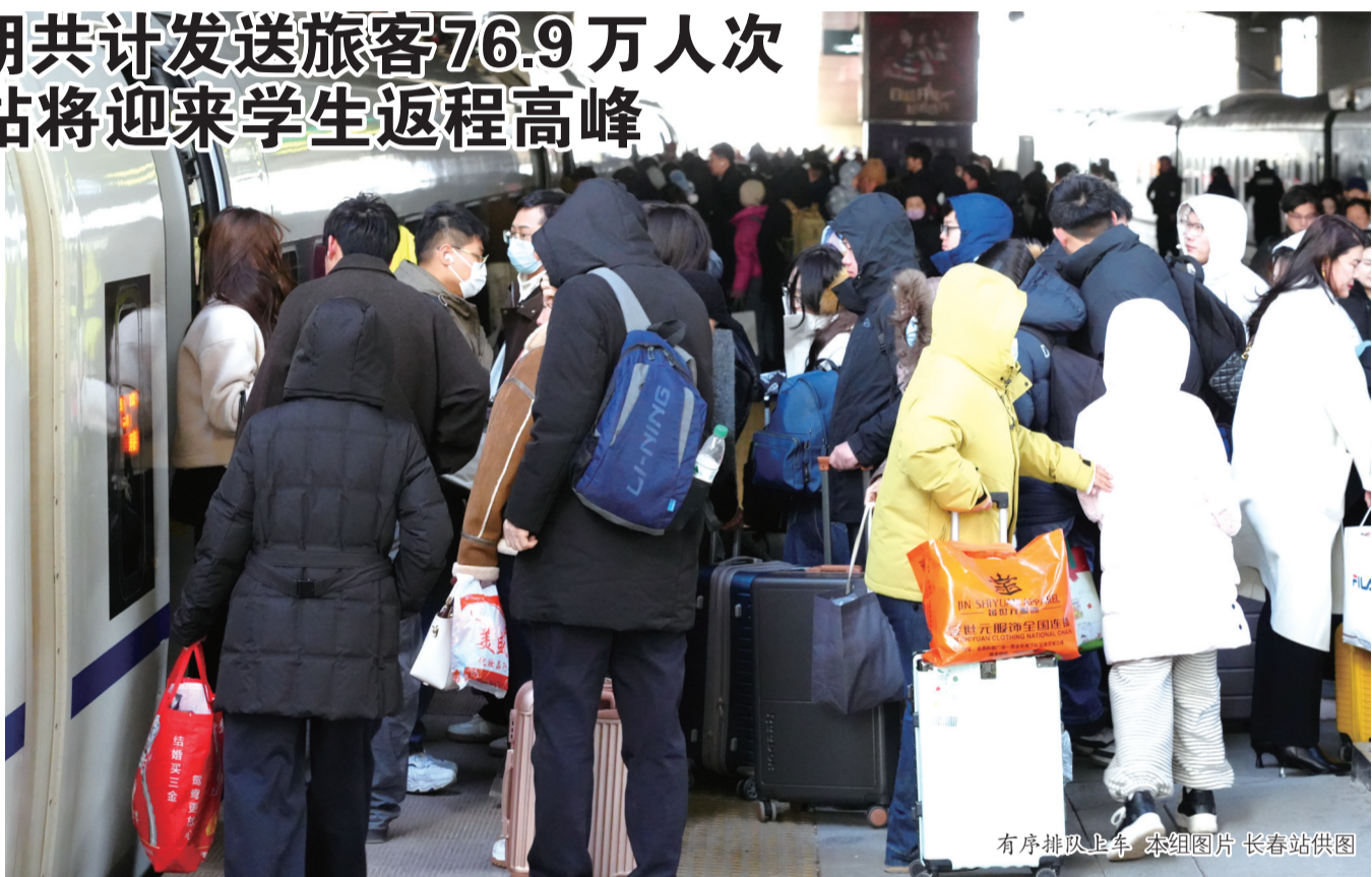
有序排队上车