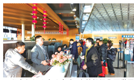
长春机场迎客流高峰

旅客吞吐量更是实现历史性突破,迎来连续攀升的高光时刻。2月18日至21日,长春机场旅客吞吐量连续4天刷新单日纪录,节节攀升、屡创新高:2月18日旅客吞吐量达68899人次,2月19日攀升至70132人次,首次突破7万人次大关;2月20日进一步增长至72519人次,2月21日再创新高,达到73105人次,2月23日达到81048人