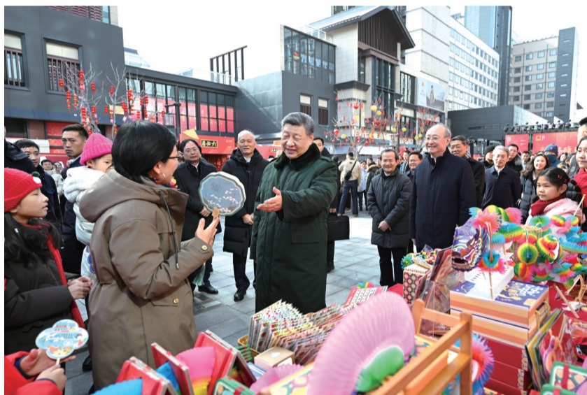
2月9日至10日,中共中央总书记、国家主席、中央军委主席习近平在北京考察并看望慰问基层干部群众。这是10日上午,习近平在东城区隆福寺街区新春市集考察时,同现场群众亲切交流。

9日上午,习近平来到位于北京亦庄的国家信创园,详细了解信息技术创新应用等情况,仔细察看人工智能、机器人