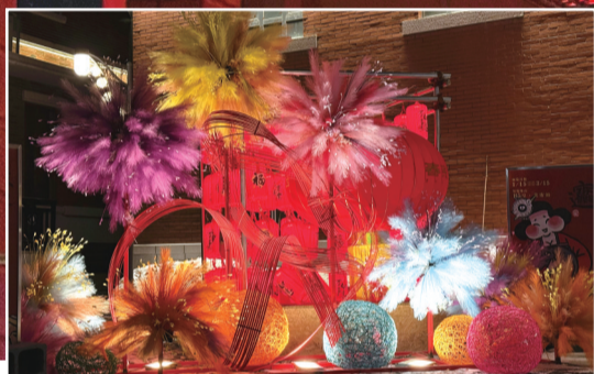
令人震撼的光影秀