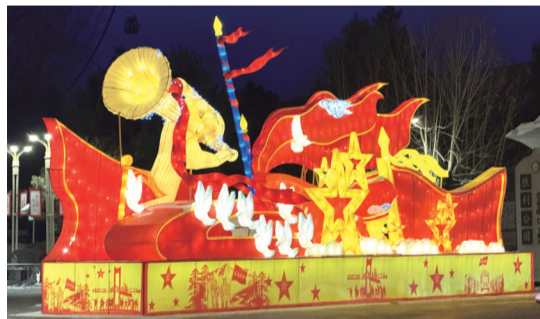
胜利公园门前亮化景观