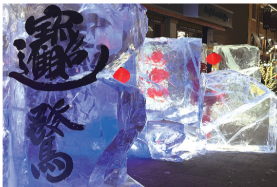
春京西历史文化街区冰灯