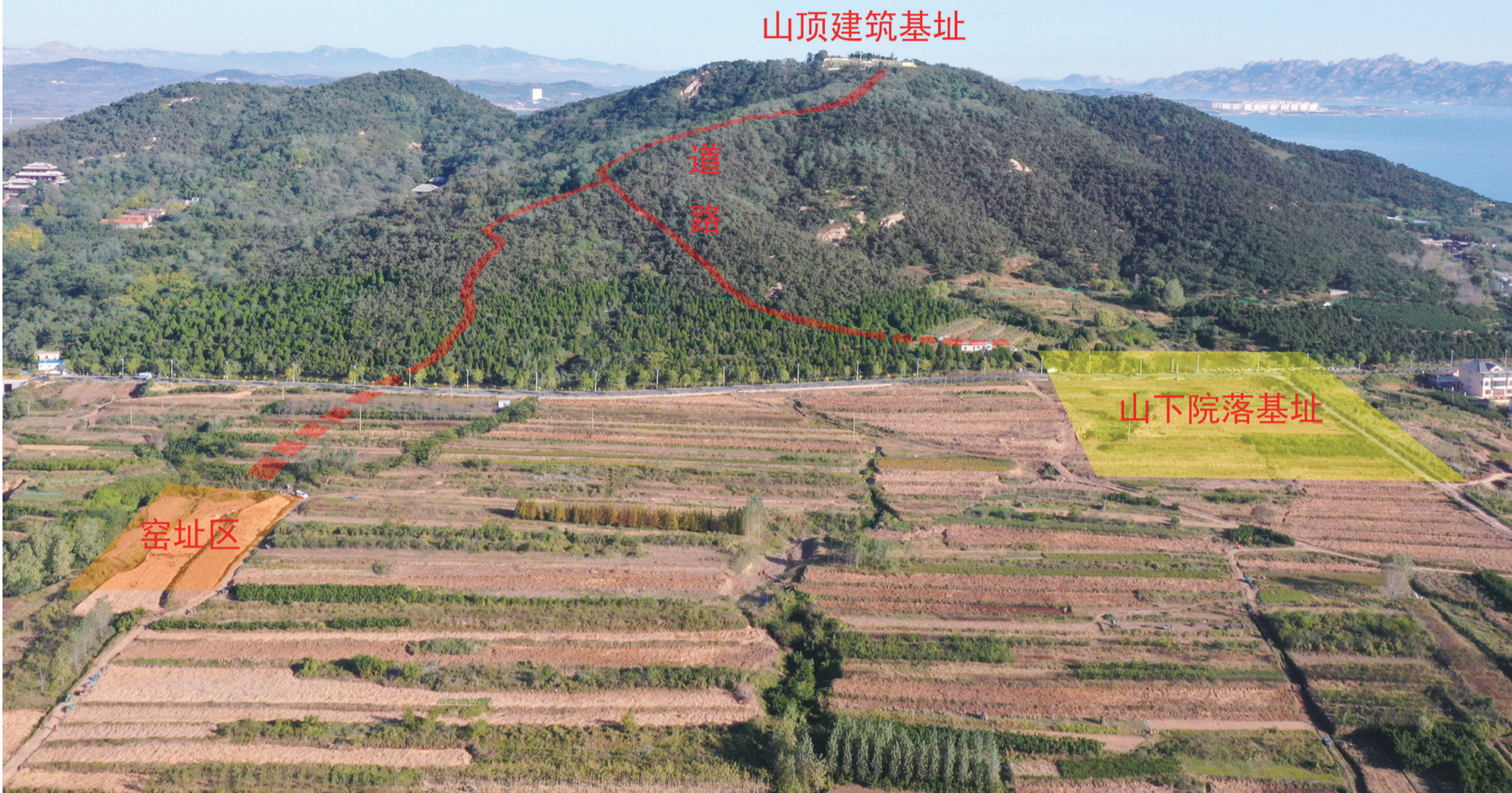
山东青岛市琅琊台战国秦汉时期遗址山顶建筑与山下院落、窑址区位置示意图(资料照片)。本组图片 新华社发

2月4日，中国社会科学院发布“2025年中国考古新成果”。河北阳原县新庙庄旧石器时代遗址、河南新郑市裴李岗石器时代遗址、河北张家口市郑家沟红山文化遗址、新疆温泉县呼斯塔青铜时代遗址、山东青岛市琅琊台战国秦汉时期遗址、新疆吐鲁番市巴达木东晋唐时期墓群6个项目入选。