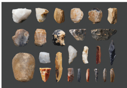
河南新郑市裴李岗石器时代遗址出土的旧石器晚期晚段典型石器(资料照片)。