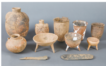
河南新郑市裴李岗石器时代遗址西部墓葬区M85出土的器物组合(资料照片)。