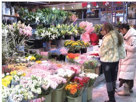
市民正在选购鲜花