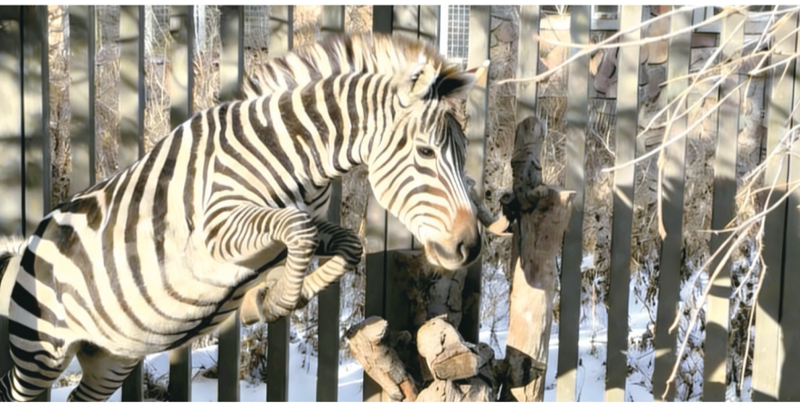
斑马腾跃

马年新春到,福暖春城来!长春市动植物公园里的斑马身披黑白华裳,带着喜庆之名、满载新春祝福给广大市民拜年,愿大家新岁皆得所愿,万事顺遂无忧!