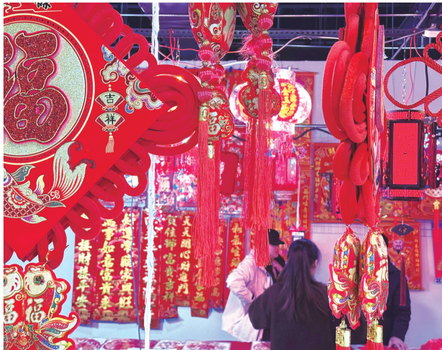
市民选购春联和红灯笼