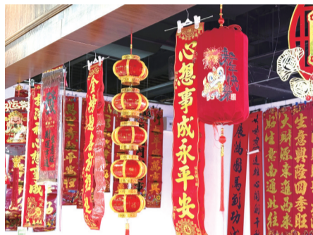
喜庆的春联和挂饰

2月4日,迎来二十四节气之首“立春”节气,农谚中有“‘立春’伊始一年端,全年大事早盘算。”的说法。同时,春节又进入倒计时,城市晚报全媒体记者走访发现,长春市民吃春饼、选春联、购鲜花,迎接“立春”“春节”的仪式感满满。