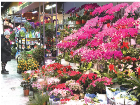
市民选购鲜花迎接春天