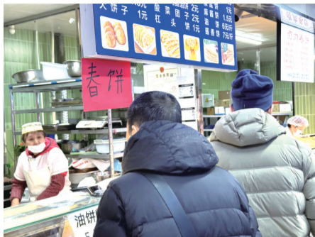
立春节气市民买春饼