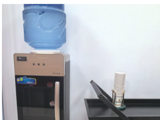
爱心驿站配置饮水机