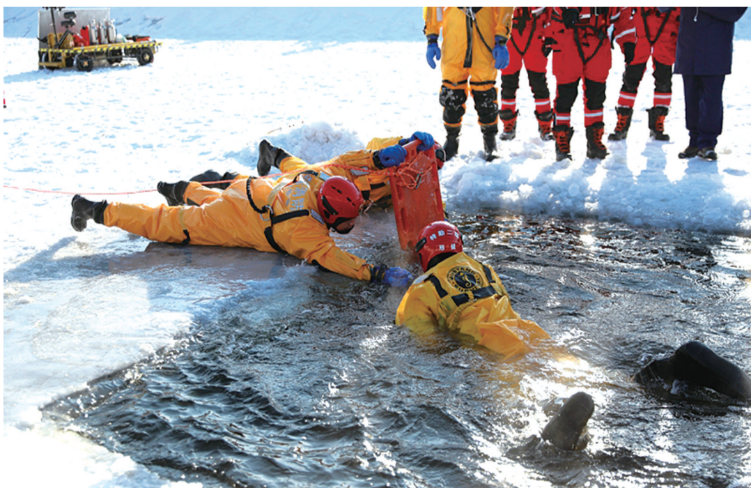
冰上救援训练