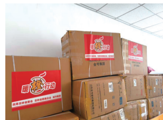
爱心物资集结到位