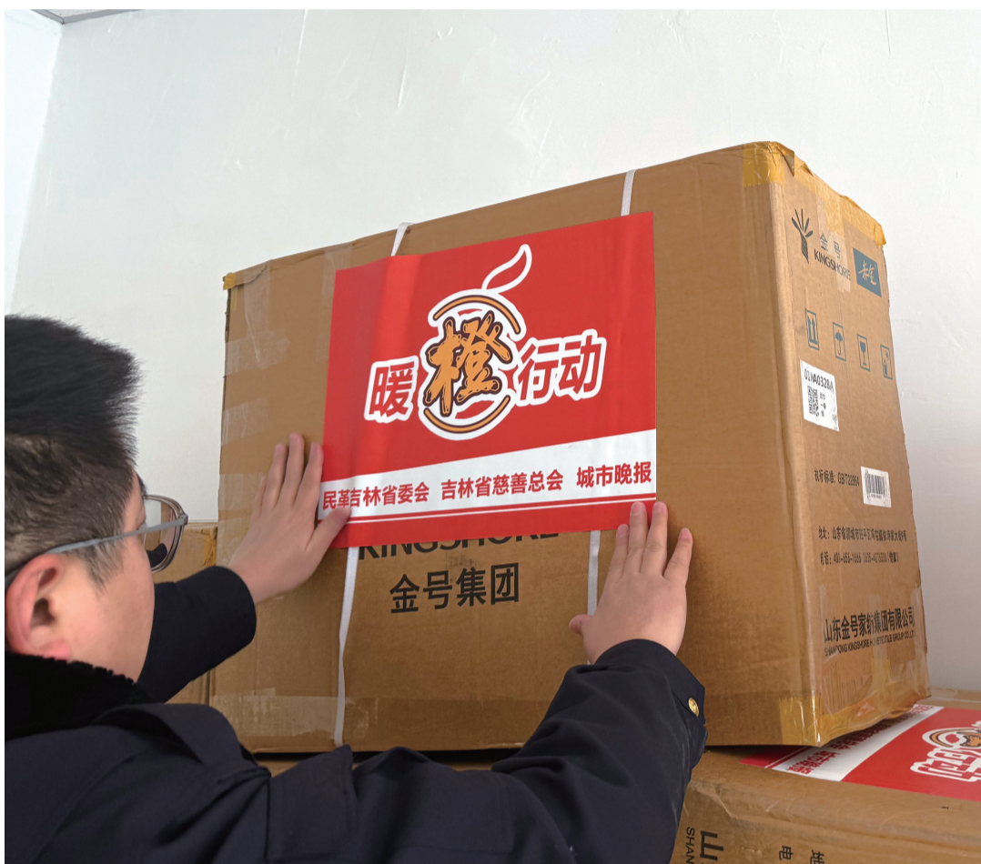
粘贴“暖橙行动”标识