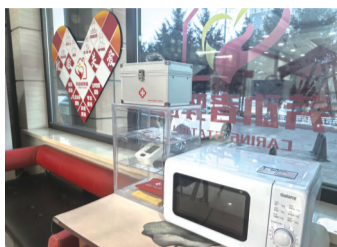
爱心驿站的微波炉