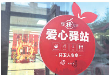
吉林农商银行长春新区支行爱心驿站标识