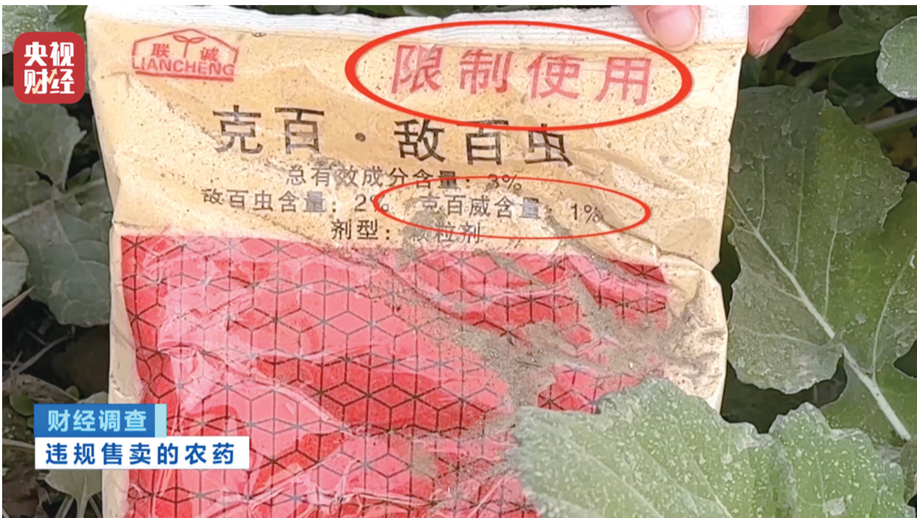
财经调查 违规售卖的农药