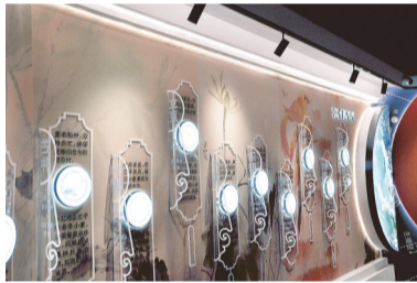
天文馆内部各展厅

据了解,吉林天文馆位于丰满区江南乡永庆村,距市区3公里,是一座全面展示世界天文发展历程与中国航天辉煌成就的现代化科普场馆。吉林市委、市政府将天文馆建设作为破解“科普资源不均衡、青少年科学启蒙载体不足”的关键举措,统筹规划、文旅、教育、科技等多部门力量,锚定打造“青少年科学梦想孵化地”和“全民天文素养提升平台”两大核心目标。