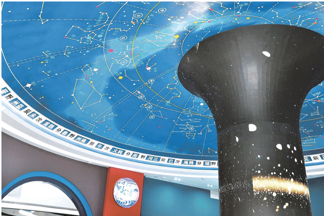
天文馆一楼大厅的穹顶 本组图片均为资料图片

1月17日上午,吉林天文馆正式开馆,这座东北地区唯一融合华夏古天文文明、现代天文文明与航空航天科技的综合型科普场馆正式向公众开放。