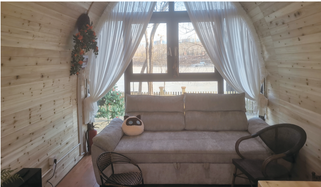
“友谊书苑”营地