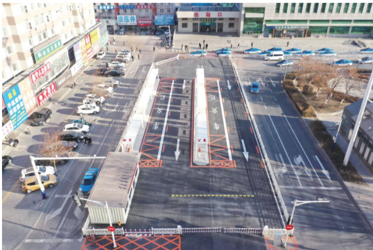
站前公交首末站

升级后,该站点接入智能调度系统,发车准点率从85%跃升至98%以上,单程运营时间平均缩短2分钟,高峰期拥堵问题得到根治。候车区设置扫码支付指引和“车来了”APP下载标识,实时查询车辆位