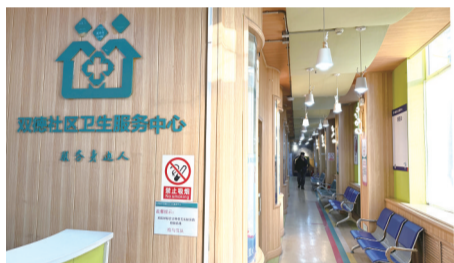
长春新区双德社区卫生服务中心