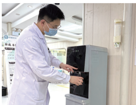
饮水机供环卫工人使用