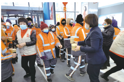
志愿者团队为环卫工人送热茶 资料图片

性活动,现在已累计开展了近70场公益活动。他们团队的所有志愿者都希望,以此带动社会更多力量来尊重和关爱环卫工人。