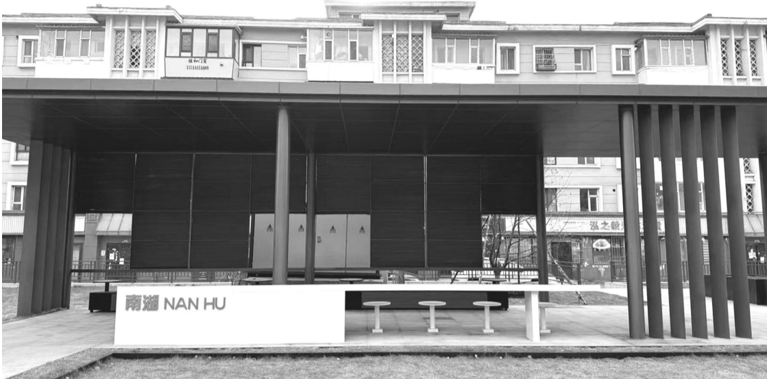
新增一处休闲空间