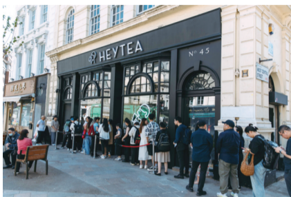
喜茶伦敦店门店的排队景象

新华社北京11月16日电 从中式新茶饮的美学浸润到中国潮玩的创意绽放,如今,越来越多中国品牌正通过创新设计承载文化内核,以多元形态不断走进海外消费者日常生活,让世界更直接地触摸到中国文化的独特魅力。