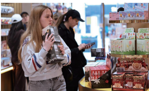
5月21日,顾客在泡泡玛特英国伦敦牛津街店内选购。