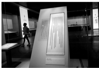
10月28日拍摄的我国迄今发现时代最早的竹简——曾侯乙墓竹简。