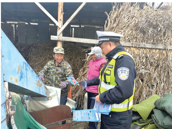
将“安全”送到群众身边

活动中,民警主动将宣传阵地前移,深入田间地头,通过面对面唠安全、发放宣传资料等形式,向群众详细讲解酒后驾驶,涉牌涉证,超员超载,农用车、三轮摩托车违法载人、人货混装,骑乘电动车、摩托车不戴安全头盔,驾乘车不系安全带等交通违法行为的危害性。此外,在宣传活动中,民警还重点关注部分农用车、三轮车因使用时间久、维护不到位,存在灯光不全、无反光标识等安全隐患,现场为车辆粘贴反光标识,手把手教大家检查车辆刹车、灯光等关键部件,提醒驾驶人每次出行前务必做好车辆安全检查,避免“带病”上路。遇到骑电动