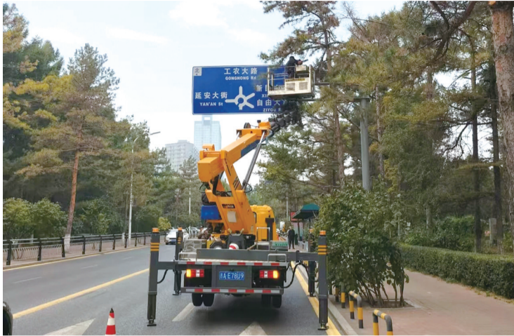
绿管中心对遮挡的树枝及时修剪

以此为契机,绿管中心举一反三,同步对辖区内26条主次干道开展“拉网式”排查。巡查人员随身携带高枝剪、手锯等工具,对影响交通信号灯、指示牌显示,或存在低垂、侧生妨碍通行视线的乔木,实施“一树一策”式精细化修剪,做到随查随修、日清日结,切实为城市交通“让”出安全视野,为市民出行“剪”出畅通空间。