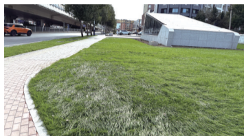
亚泰大街站点周边恢复绿化

如果你最近穿行长春市主城区,或者打车时走过南湖大路一带,应该已经发现不少施工围挡不见了。别小看这变化,对很多在主城区生活、出行的市民来说,拥堵、绕行的烦恼在实实在在地变少。