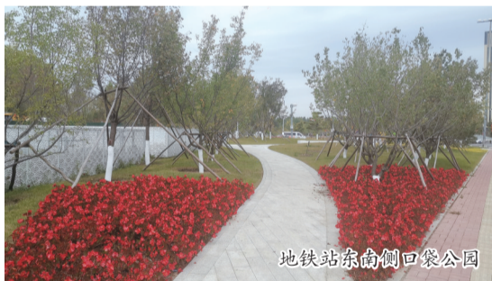
地铁站东南侧口袋公园