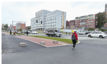
市民出行安全又顺畅