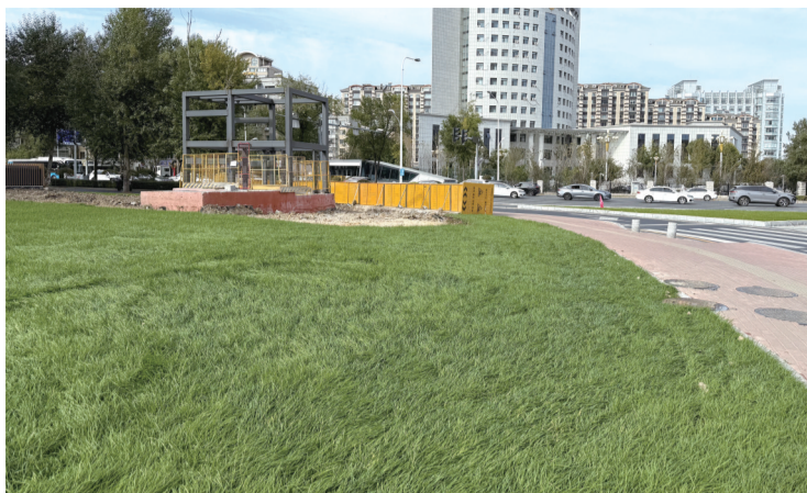
改造后环境大大提升

在南湖大路与辉南街交会处,曾是7号线的一处重要施工节点,施工围挡撤出后,平整的柏油马路和崭新的交通警示线首先映入眼帘,目前南湖大路主干道已全面恢复正常通行,现场车流顺畅。不少居民