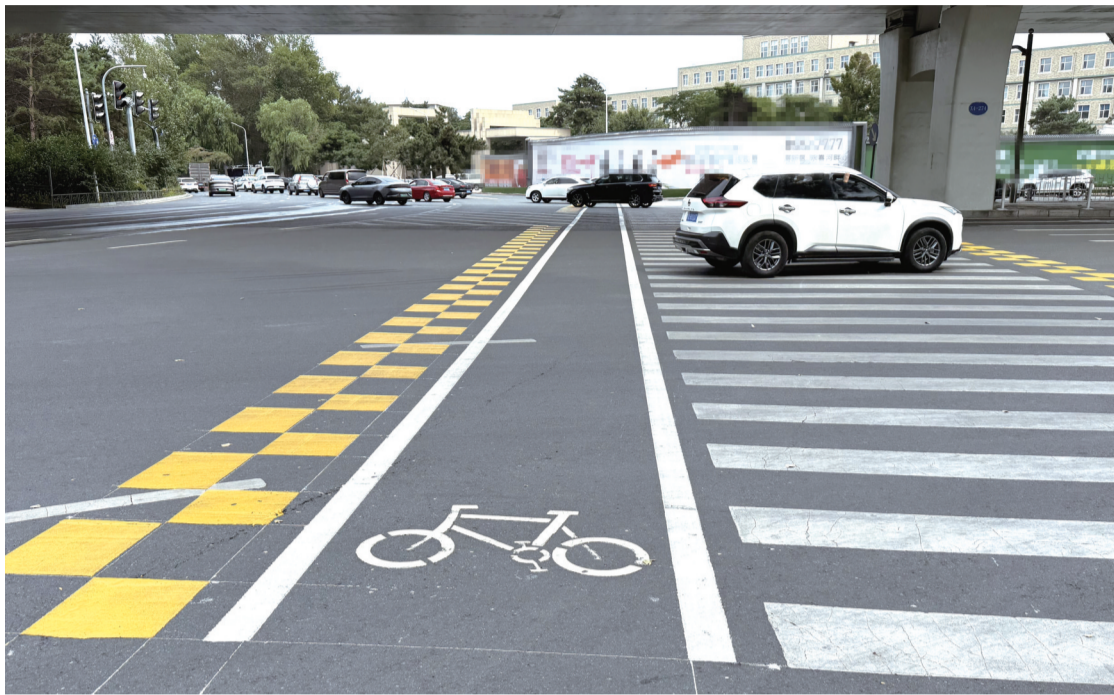
斑马线两边均划上“黄色方块”

“现在接送孩子,从这里过马路更放心了。”近日,长春市民赵女士经过前进大街路口时,发现人行横道变得更有“安全感”了。