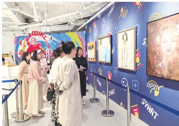
现场观展

9月8日下午3点,第十届亚洲青年艺术家提名展长春站在吉林广播电视塔宋洋美术馆盛大启幕。本次展览以“冻土之下,星丛成长”为主题,汇聚了来自亚洲各地的青年艺术家,带来一场跨越地域与文化的艺术盛宴。