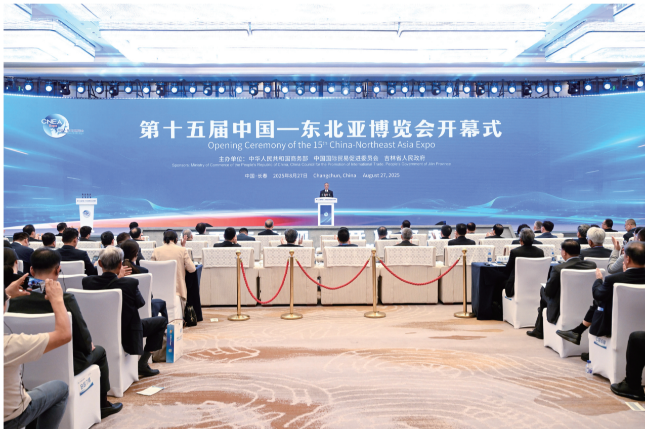
8月27日,第十五届中国—东北亚博览会在长春开幕。全国政协副主席胡春华出席开幕式并致辞。

蒙古国第一副总理兼经济发展部部长尼·乌其尔勒发表书面致辞,蒙古国经济发展部国务秘书伊·巴特呼代为宣读。中国商务部副部长鄒东、韩国产业通商资源部通商交涉室长卢建基、中国国际贸易促进委员会副会长李兴乾、巴斯夫集团全球副总裁晏思先后致辞。朝