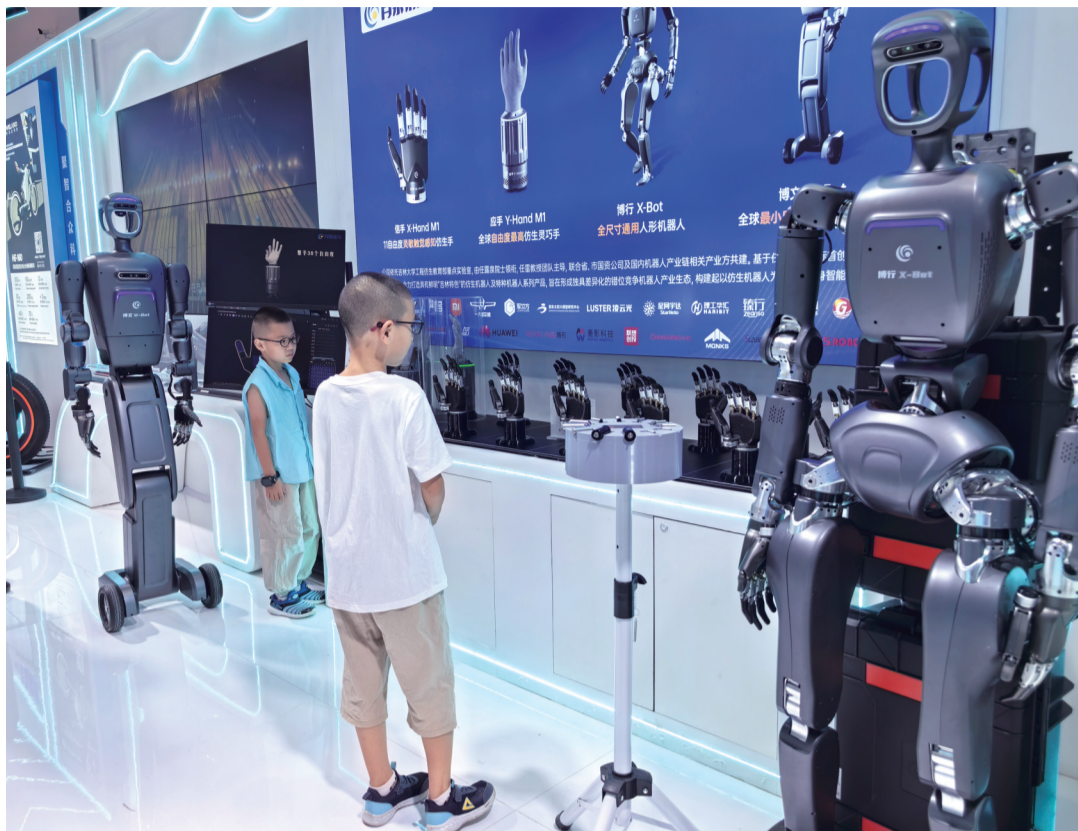
仿生机器人和仿生手引人关注

轮式人形机器人“博文W-Bot”则可在模拟仓储货架场景中,折叠起“髌-膝-踝”关节,仅0.2平方米的底盘轻松穿梭于狭窄