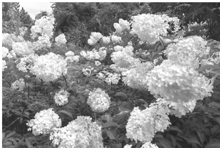
木绣球“香草草莓”

其中“抹茶”以其硕大的花序(长可达40厘米,宽可达30厘米)和直立挺拔的植株格外引人注目,其花色随时间变化,从淡抹茶绿逐渐转为白色,最后晕染出淡淡的粉色,宛如自然界的调色盘;而木绣球“香草草莓”则以浪漫的粉色大花球著称,枝条微垂,花期从夏季持续至初秋,为城市景观注入了柔美浪漫的气