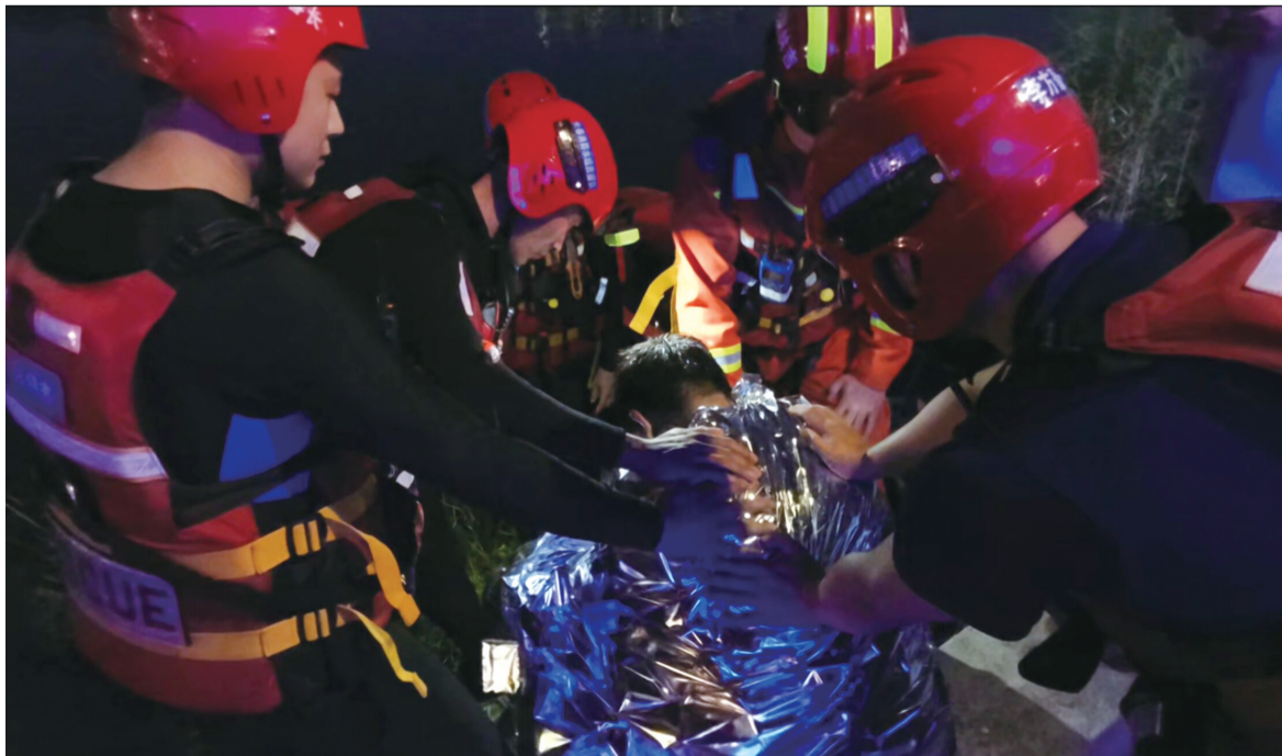
上岸后,消防员仍不住地对小伙进行劝说