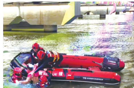
合力将小伙往艇上拽