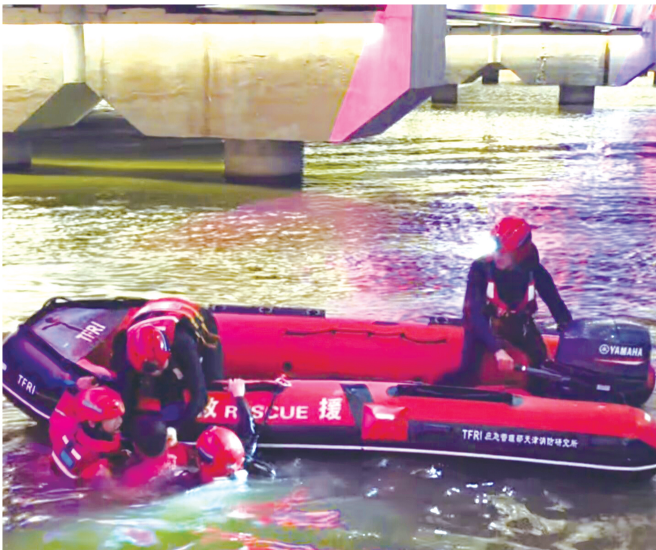
合力将小伙托出水面