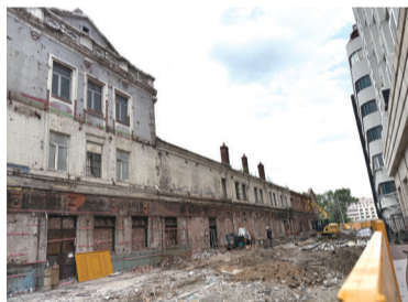
丰乐剧场旧址周边整治进行中

长春市朝阳区重庆路1019号,车水马龙间,丰乐剧场旧址修缮及周边历史文化街区建设正在有条不紊进行中。8月11日上午,城市晚报全媒体记者在现场看到,施工围挡上的效果图可直观地感受到,修缮后的建筑将修旧如旧、还原本真。