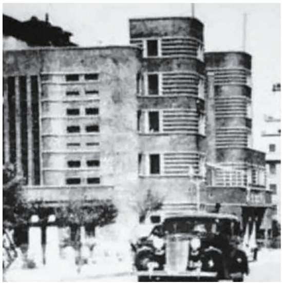
丰乐剧场历史照片

丰乐剧场旧址整体呈矩形,东西向总长约为38米,南北向总宽约为33米,地上为四层,坡屋面木屋架屋脊标高约为19.25米,平屋面标高约为14.850米,局部设地下一层。作为长春历史上最负盛名的影剧院之一,它曾是这座城市的文化地标,承载着几代长春人的集体记忆。如今,随着修缮保护利用工程的加速推进,这座写满了故事的历史建筑正徐徐拉开重生的序幕。