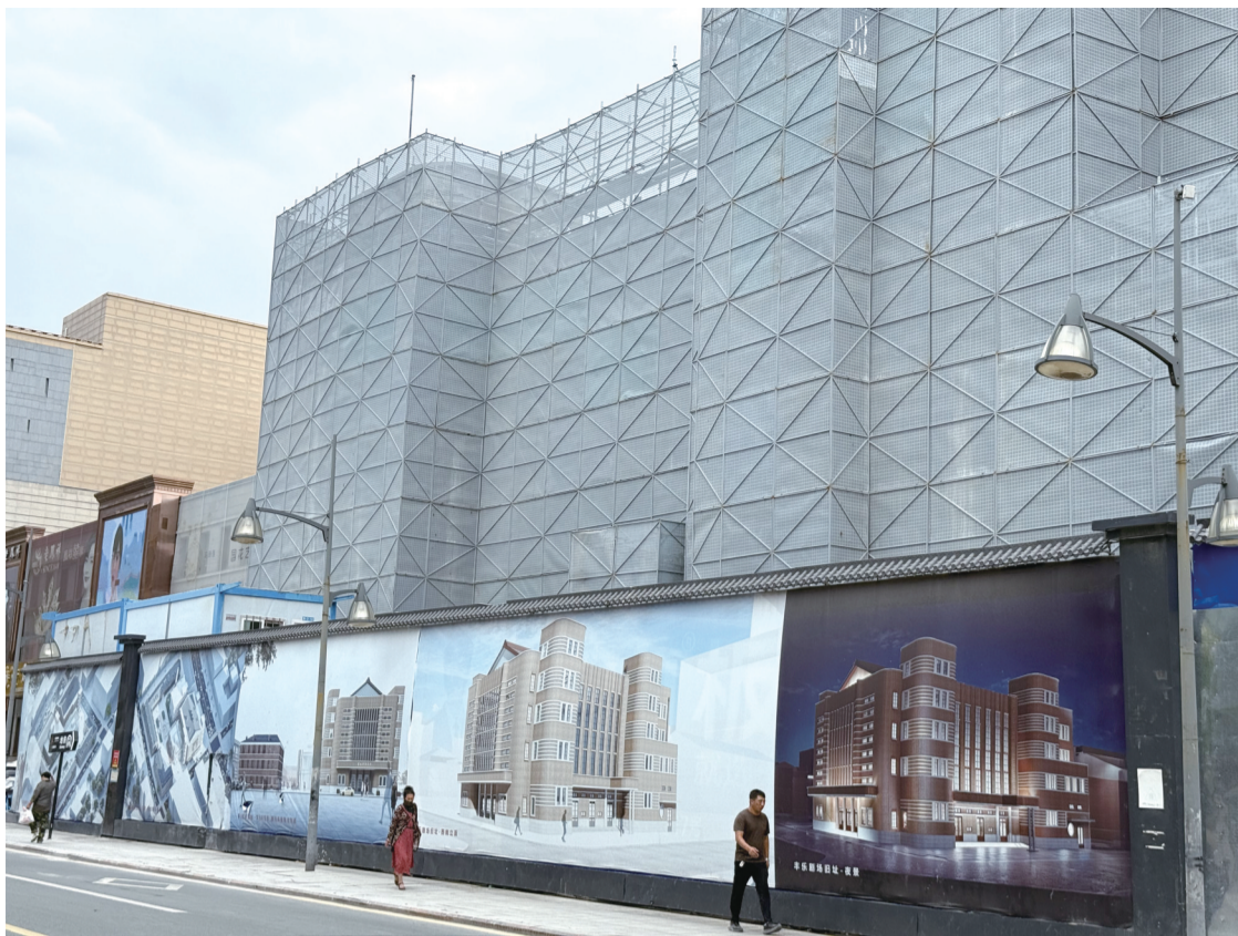
修缮中的丰乐剧场旧址