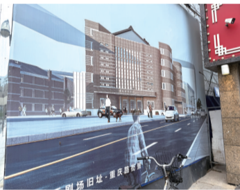
丰乐剧场旧址街景效果图