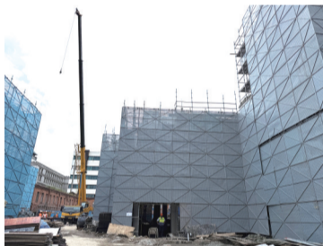
丰乐剧场旧址修缮有序推进