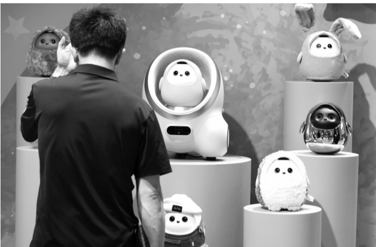
7月16日在数字科技链展区拍摄的分体式陪伴机器人。

据介绍,这款设备可完成人体浅表组织、外周血管及腹部器官等多项检查,通过一键切换探头模式