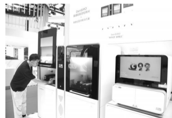
7月16日在健康生活链展区华大集团展位拍摄的高通量基因检测AI+本地化医学解决方案。

用一台小小的设备完成身体不同部位的超声检查,将人工智能运用于骨科手术中,以数字化手段助力健康生活管理……走进正在举行的第三届中国国际供应链促进博览会健康生活链展馆,几乎每一个展区都像是一个微缩的创新实验室,不仅展现从出生到养老的全生命周期健康产业链条,更让观众直观体验最前沿科技成果,感受到“让生命更加精彩”的美好愿望正化为触手可及的现实。