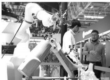
这是7月17日在健康生活链展区拍摄的AI+全骨科手术机器人。