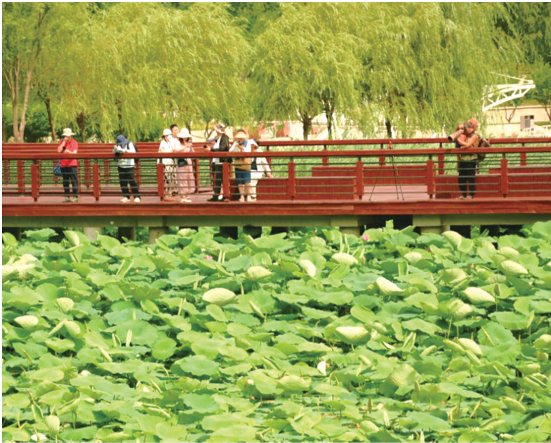
美丽风光吸引了众多游客