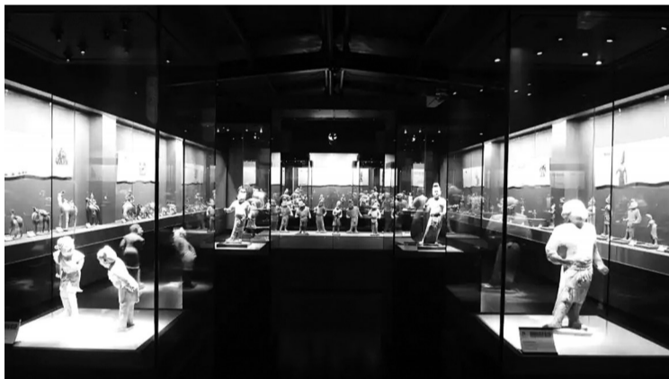
这是“西游记——唐代陶瓷中的丝路文明”展展厅。