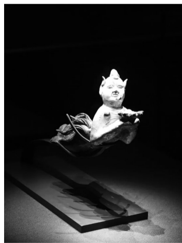
这是展出的三彩釉陶飞天。