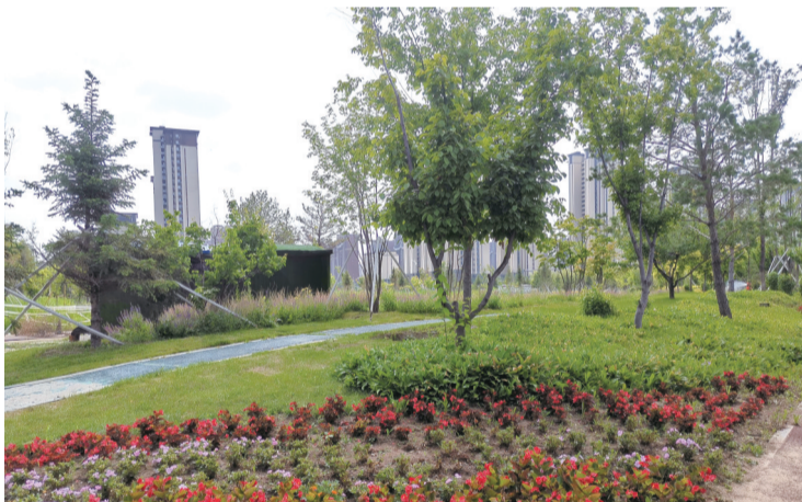
湖畔街街角公园环境优美

除此之外,长春新区对原有的公园不断完善,处处体现着人性化设计。前进公园重新规划后,不仅铺设了专业的跑步步道,还贴心地设置了下沉式活动空间,让居民在