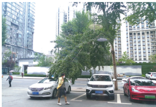
行人车辆纷纷避让

7月3日早上,有市民向城市晚报全媒体记者反映,在长春市朝阳区前进大街与湖光路交会口西行百米处,一棵生长在路边的杨树突然侧枝断裂,垂落在路中间的半空中,晃悠悠随时可能掉落,吓得行人纷纷躲避绕行。