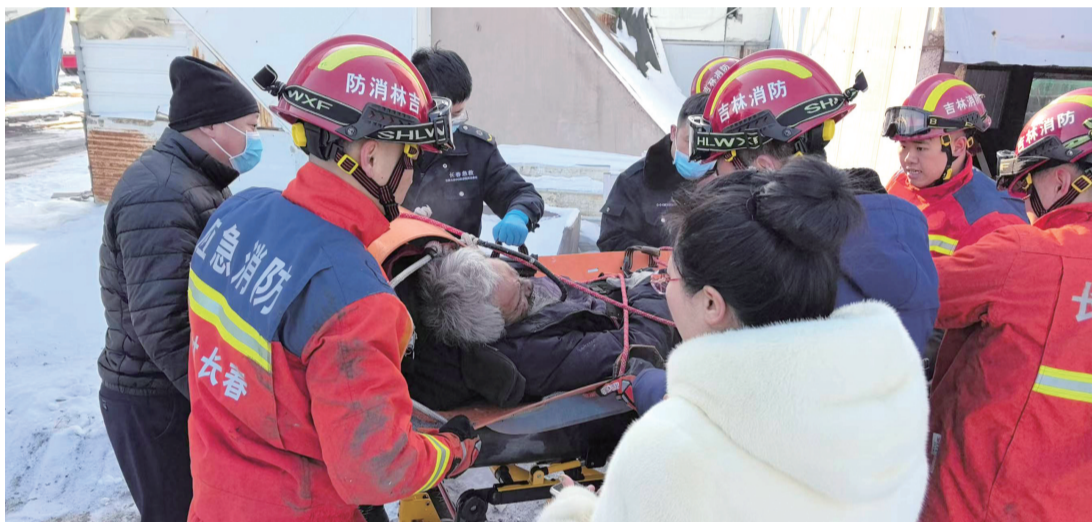
成功将老人救出