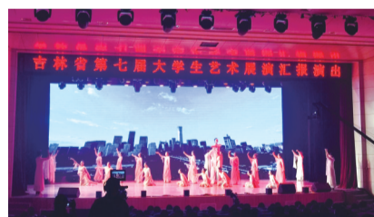
作品《看见你的声音》