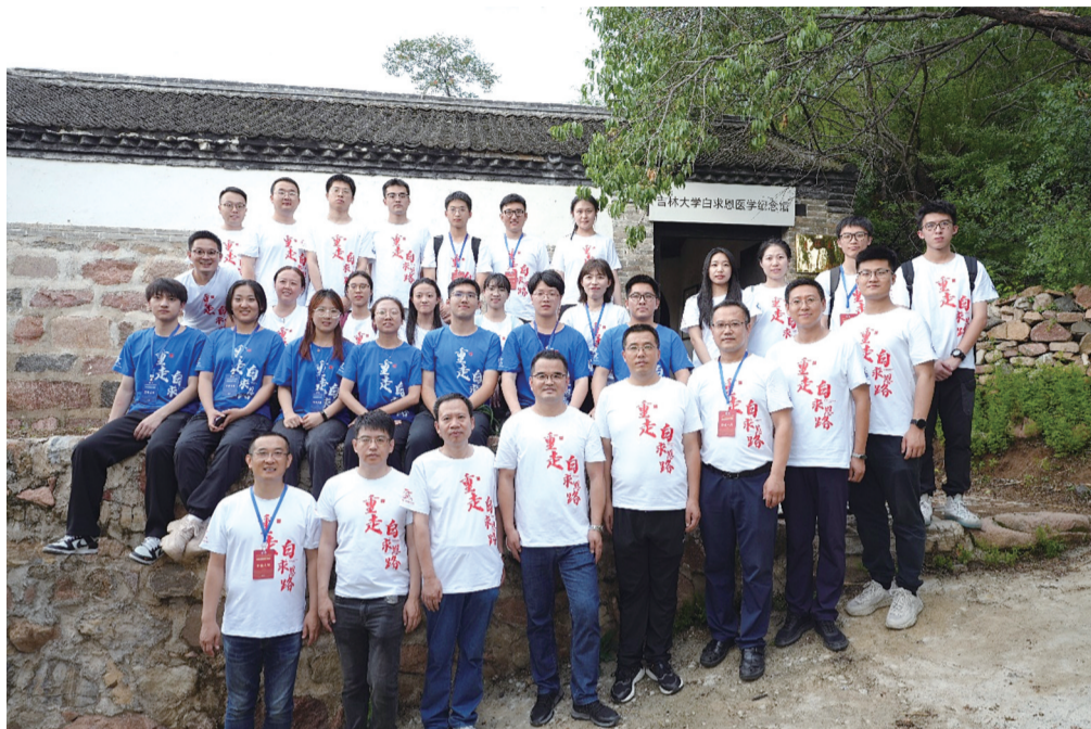
实践活动