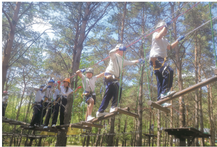
同学们过独木桥

目前,净月潭森林探险乐园内总共有5条探险线路,紫1线路,紫2线路,黄、绿、蓝线路,可以说是涵盖了全年龄段人群,从难度系数,通关技巧,难度从紫1线路到蓝色线路依次递增。而每个线路由于关卡难度、跨度、通关时间不同,适龄人群是不同的。而现场就有同学在挑战完黄色线路后,信心爆棚,想挑战更难的线路闯关。