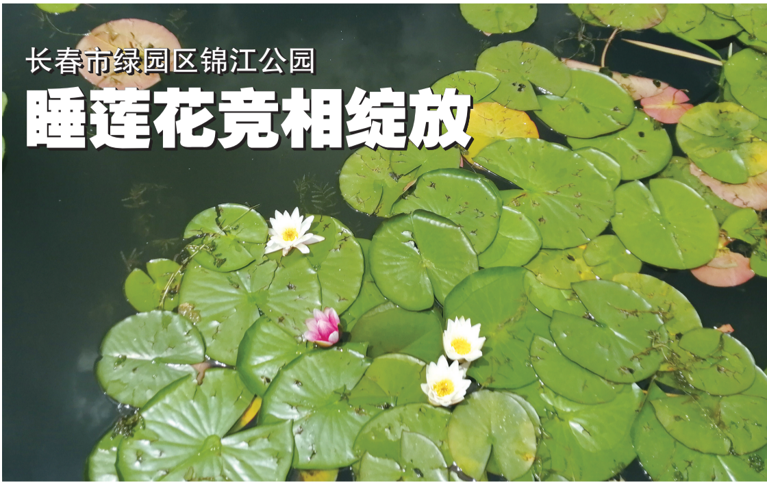
美如画卷

随着夏日的到来,气温不断攀升,长春市绿园区锦江公园内的睡莲迎来了盛花期。朵朵莲花竞相绽放,一花一叶一池娇,构成了一幅绚丽多彩的夏日画卷,吸引不少市民前来观赏拍照。