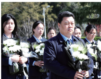
向烈士纪念碑献花

春风送暖,清明时节。为深切缅怀革命先烈,弘扬爱国主义精神,3月29日,中铁建物业上海中心城市公司党支部联合团支部组织开展“缅怀先烈 铭记历史”清明祭扫活动,上海中心城市公司全体党员、入党积极分子、青年团员、项目思想政治指导员等参加。