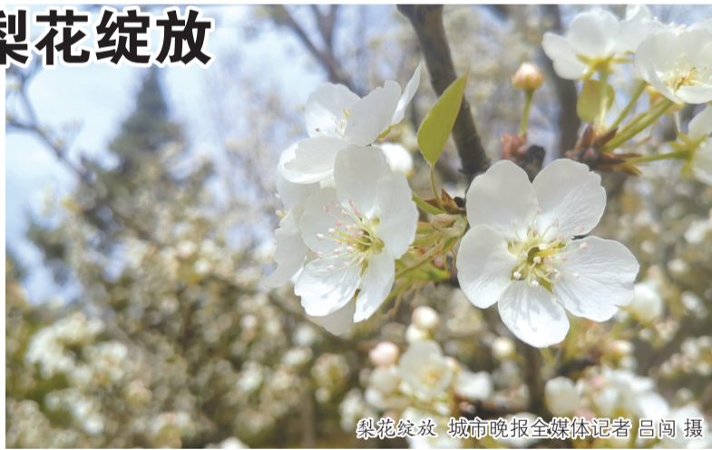
梨花绽放